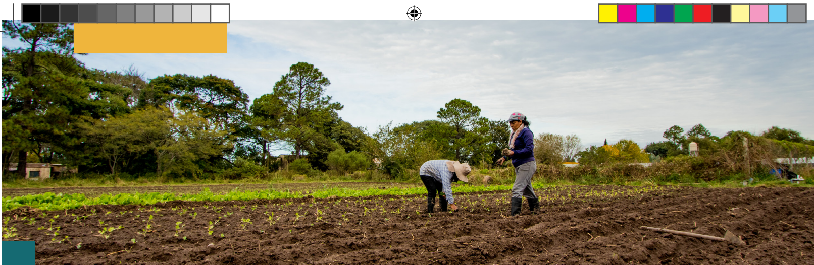
Projet agroécologique de femmes en Argentine.

de conscience écologique. Ainsi, des bureaux d'étude se consacrent aux énergies nouvelles, des magasins distribuent des productions biologiques. Dans les années 1970, une nouvelle vague d'initiatives se déploie dans les prestations de services intellectuels et culturels. La question des finalités de la production, qui n'avait pas été prise en compte par le mouvement coopératif antérieur, est posée et reliée aux moyens employés pour les atteindre. L'égalitarisme prôné dans l'organisation du travail et le fonctionnement quotidien est considéré comme la meilleure garantie pour que les moyens économiques soient convergents avec les finalités sociales ou écologiques des collectifs de production.