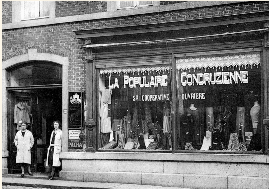
Premier magasin ouvert par la Populaire condruzienne, rue du Commerce, Ciney, années 1920.

L'associationnisme pionnier a été longtemps oublié, mais correspond à la forme pionnière du mouvement ouvrier. Il est basé sur l'auto-organisation et inclut l'aide mutuelle comme la revendication, dans des tentatives mêlant une production gouvernée par le travail, des secours mutuels, une agitation dans les